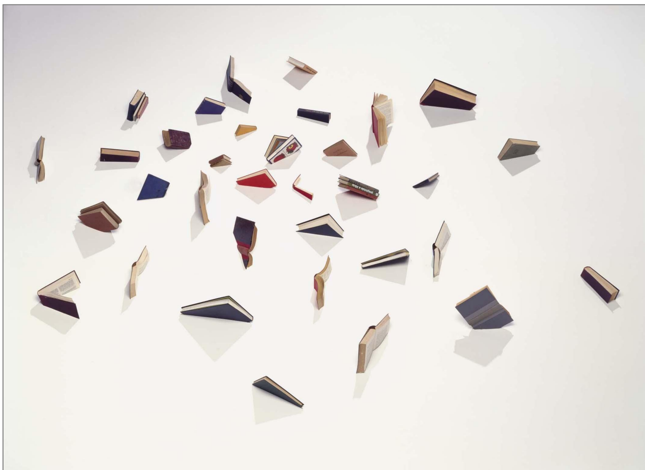
Alicia Martín, Biblioteca (1998). Museo Nacional Centro de Arte Reina Sofía, Madrid.