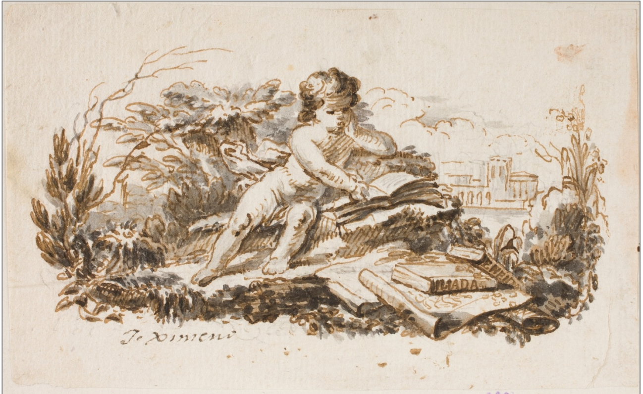
José Antonio Ximeno y Carrera, Niño leyendo en un paisaje (s.a.; siglo XVIII). Museo Nacional del Prado, Madrid.