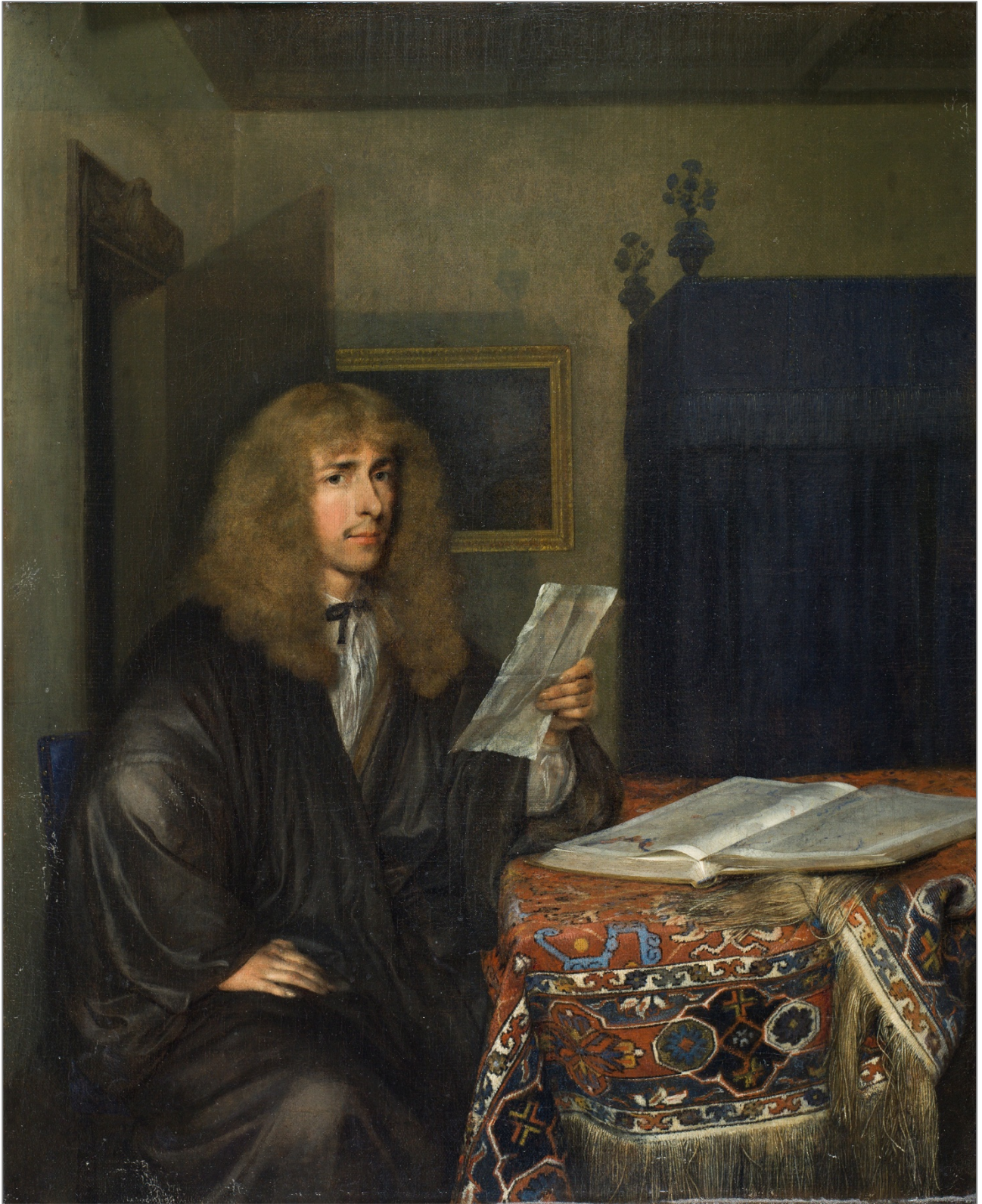
Gerard ter Borch, Retrato de un hombre leyendo un documento (h. 1675). Museo Thyssen-Bornemisza, Madrid.