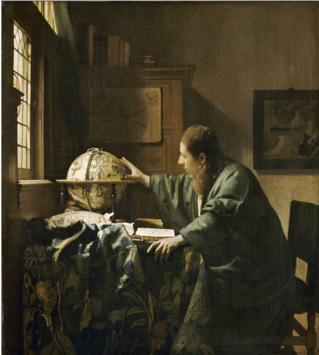
Johannes Vermeer, El astrónomo (1668). Musée du Louvre, Paris.