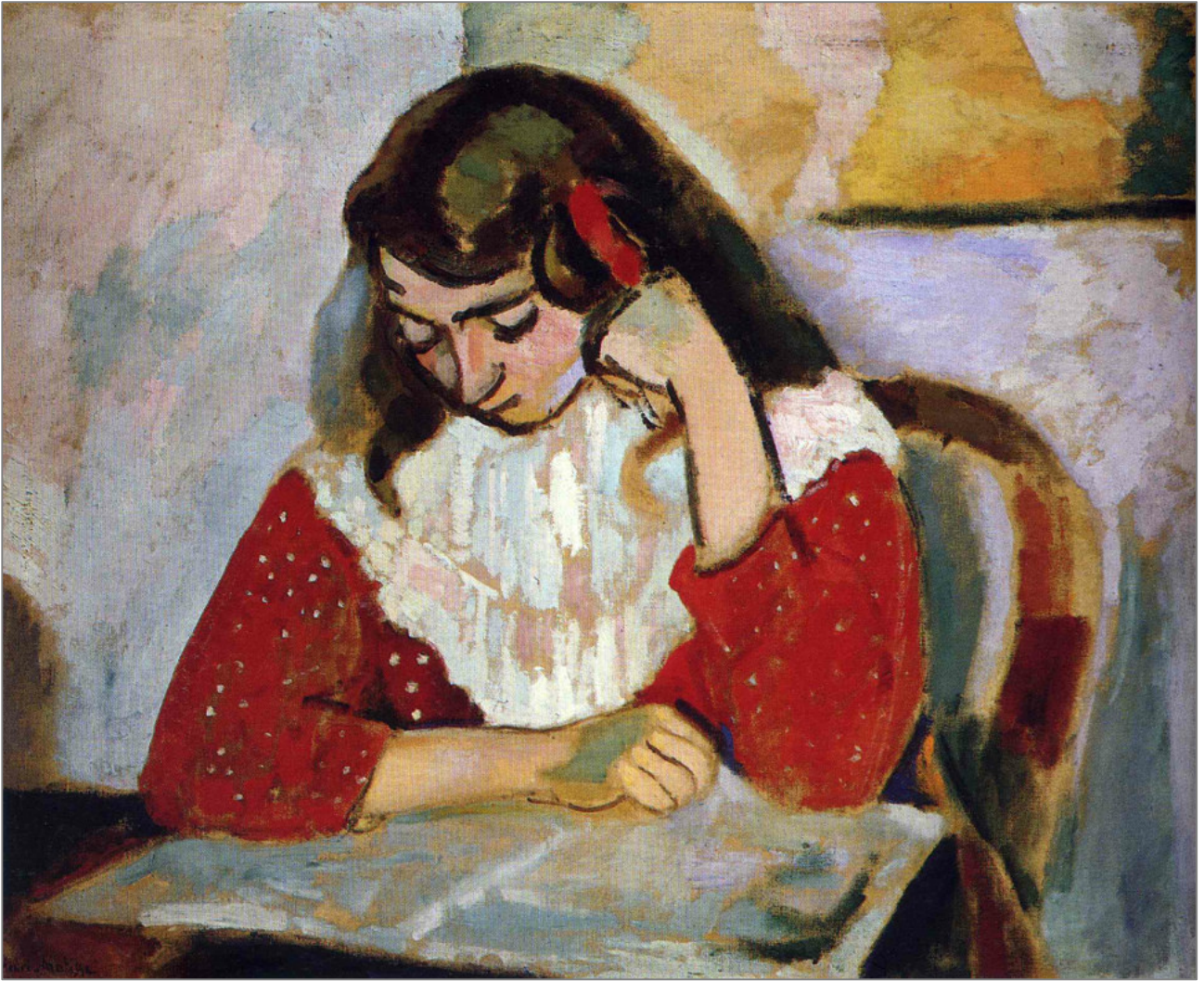
Henri Matisse, Marguerite lisant son livre (1906). Musée des Beaux Arts, Grenoble.