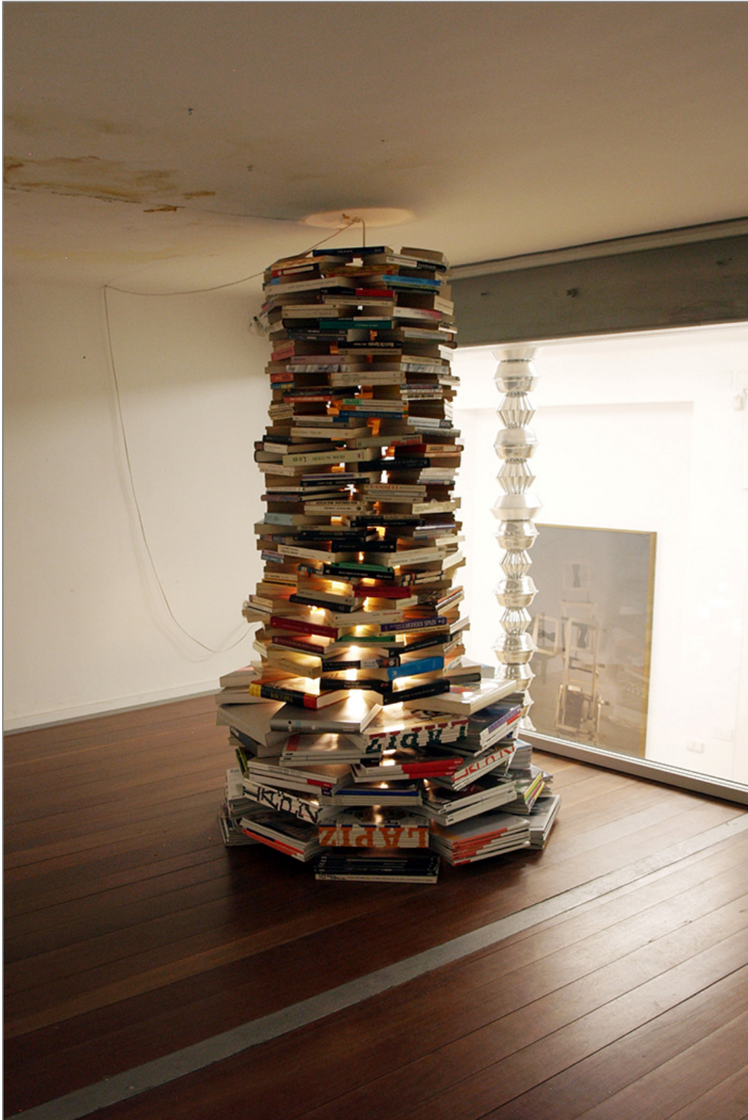
Eugenio Ampudia, Acumulador (2010). Instalación.