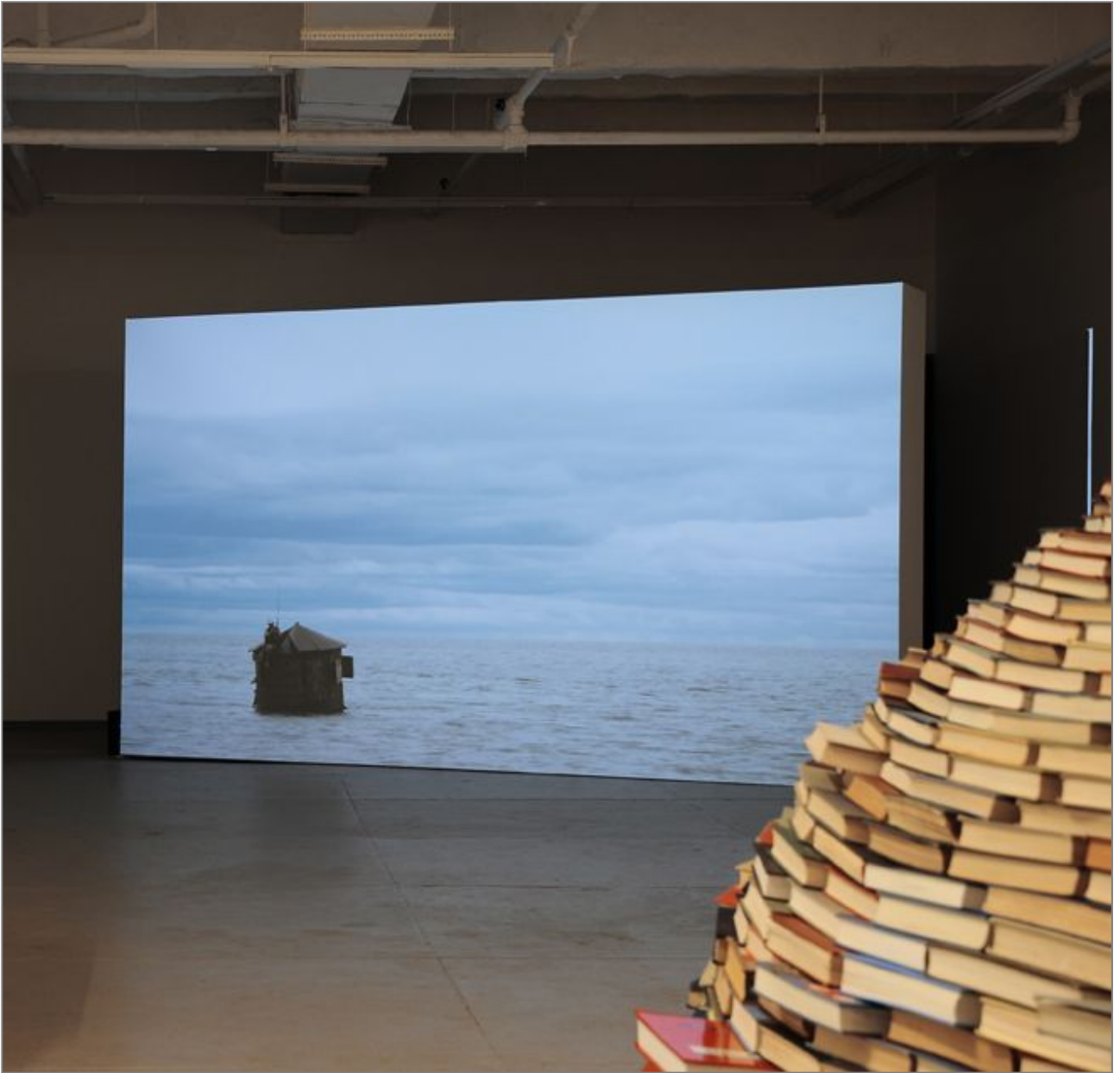
Miler Lagos, Home (2011). Magnan Metz Gallery, Nueva York.