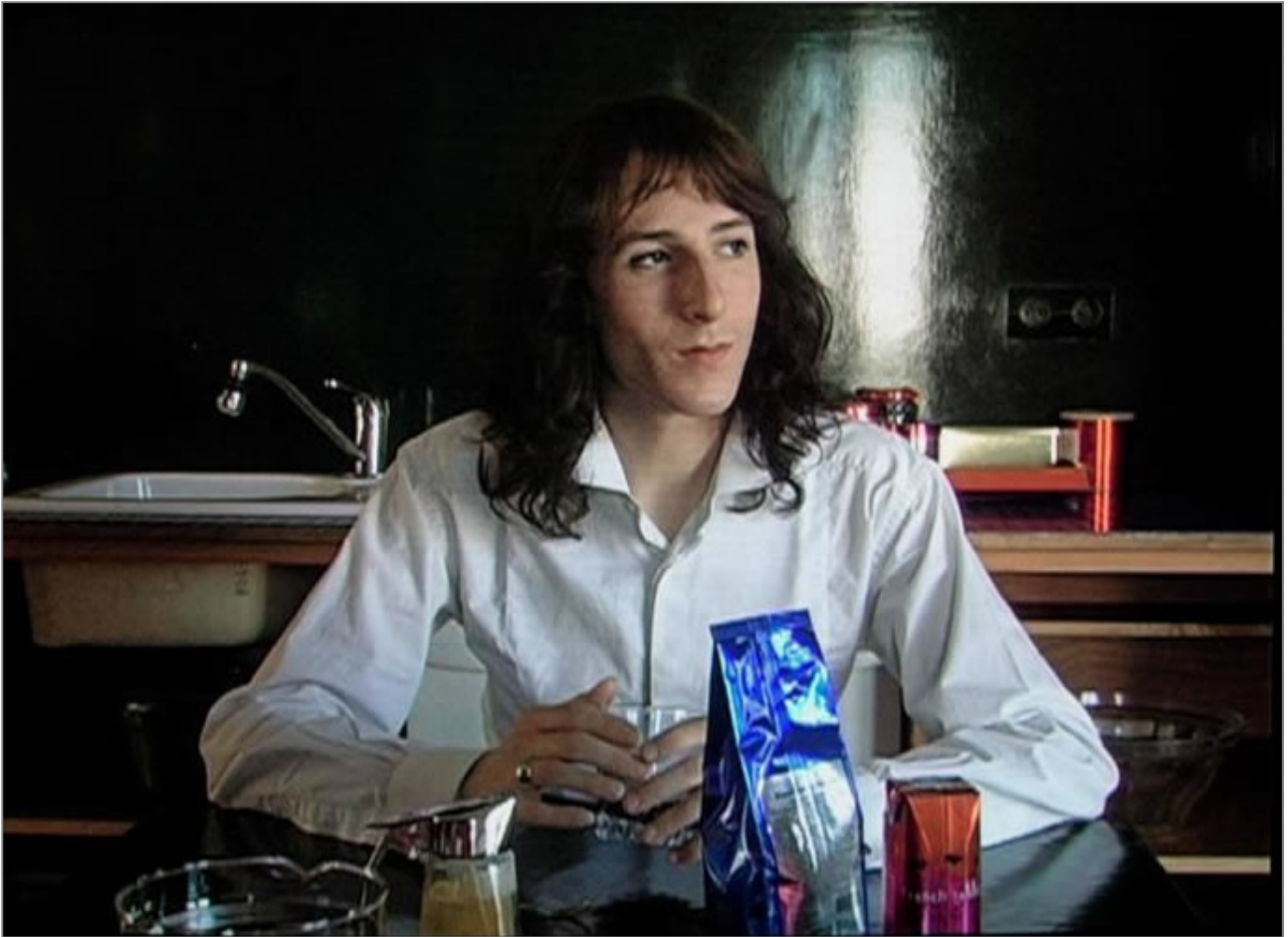
Valérie Mréjen, Bulles (2007). Performance. Centre Pompidou.