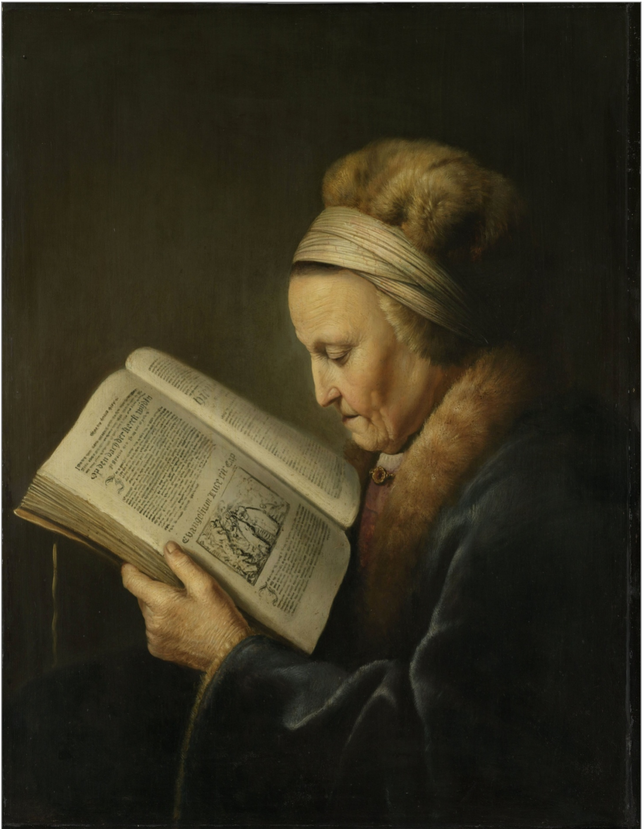
Gérard Dou, Retrato de una anciana leyendo (1630). Rijksmuseum, Amsterdam