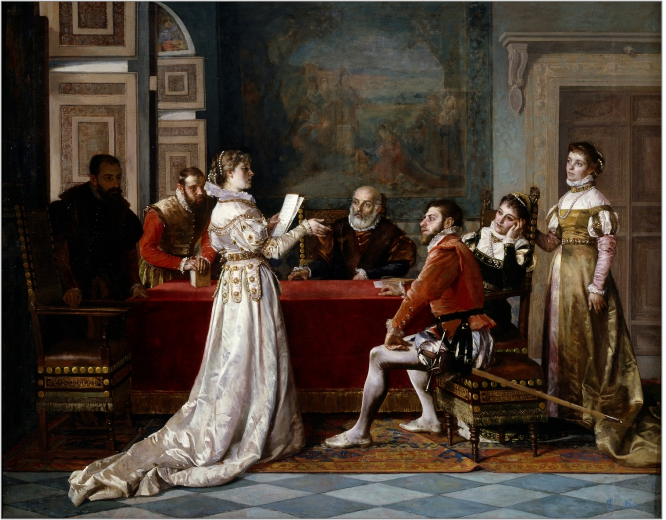
Francisco Jover y Casanova, La poetisa (h. 1880). Museo Nacional del Prado, Madrid.