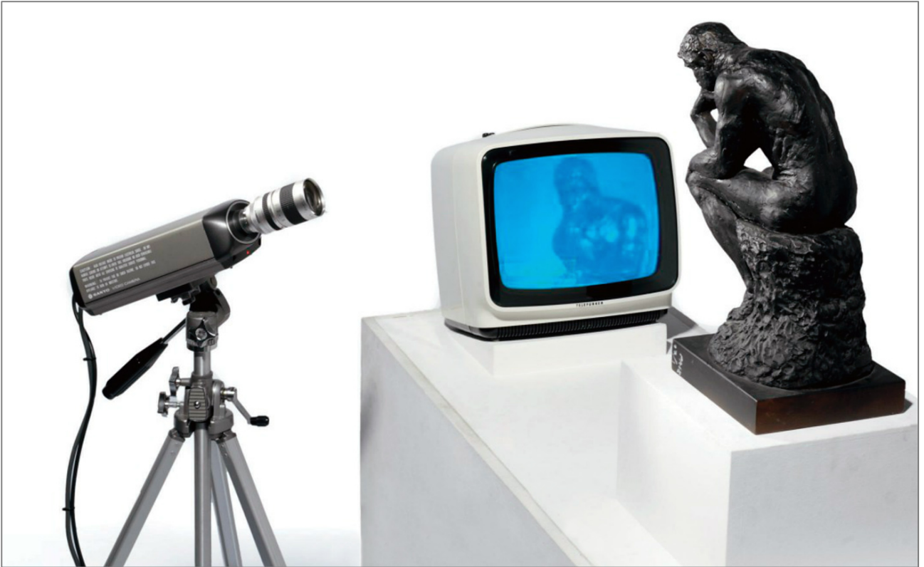
Nam June Paik, TV Rodin (1982). Carnegie Museum of Art, Carnegie Institute.