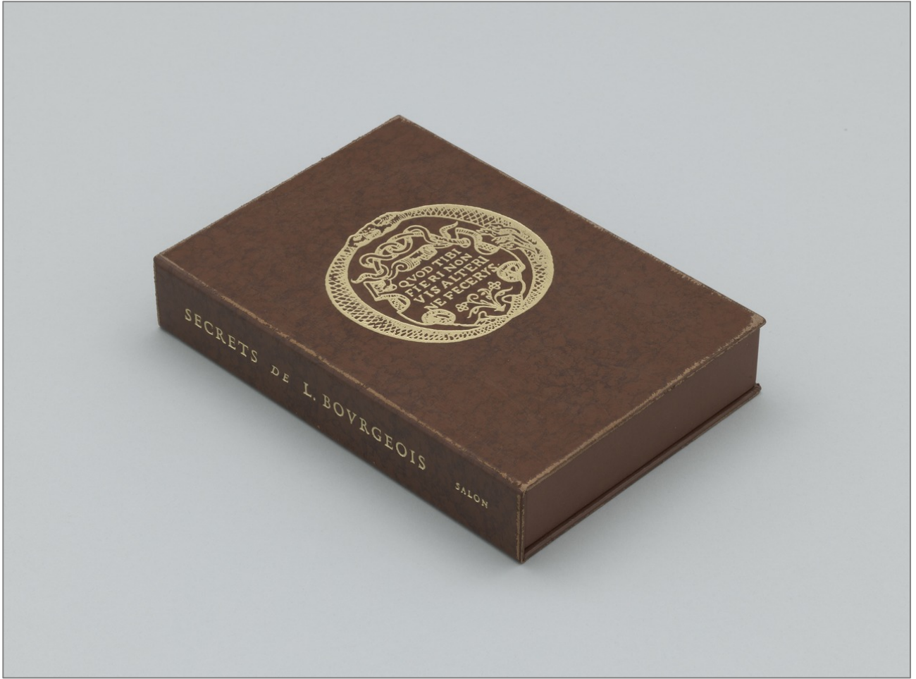
Louise Bourgeois, Recueil des Secrets de Louyse Bourgeois , deluxe edition (2005). Museum of Modern Art, Nueva York.