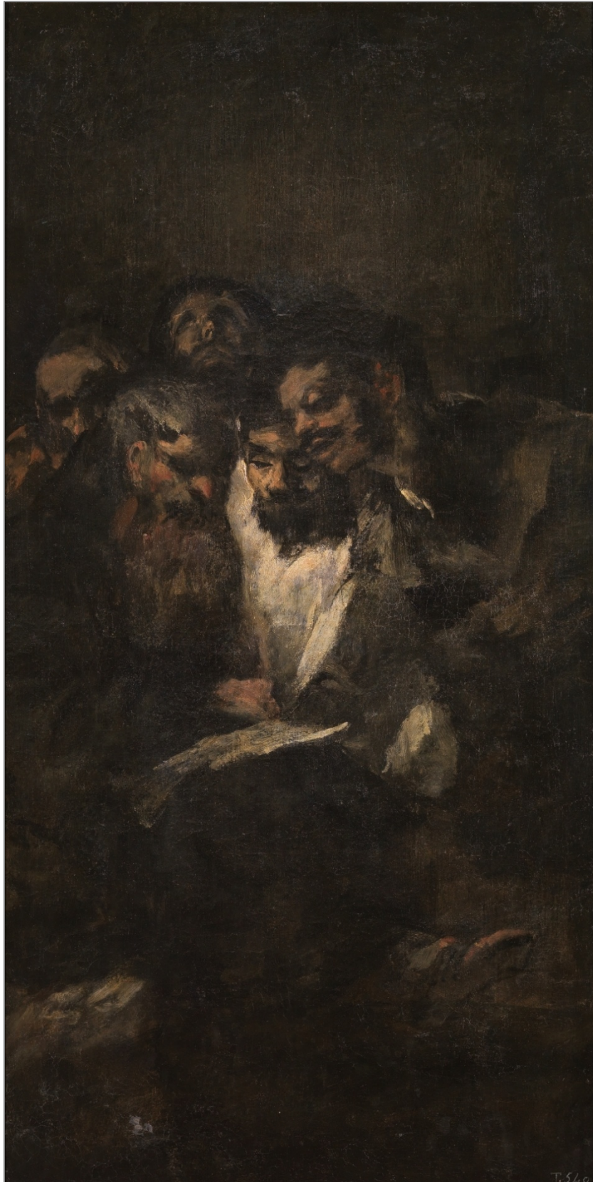
Francisco de Goya y Lucientes, La lectura (1820-1823). Museo Nacional del Prado, Madrid.