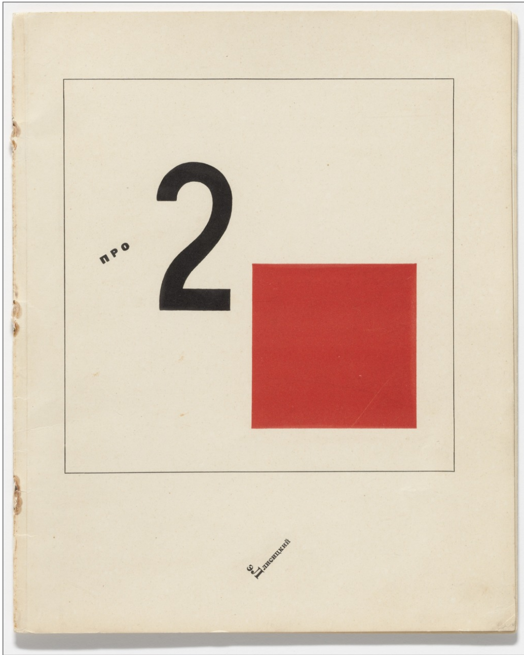
El Lissitzky, Pro dva kvadrata. Suprematicheskii skaz v 6-ti postroikakh ( Of Two Squares: A Suprematist Tale in Six Constructions ) (1922). Museum of Modern Art, Nueva York.