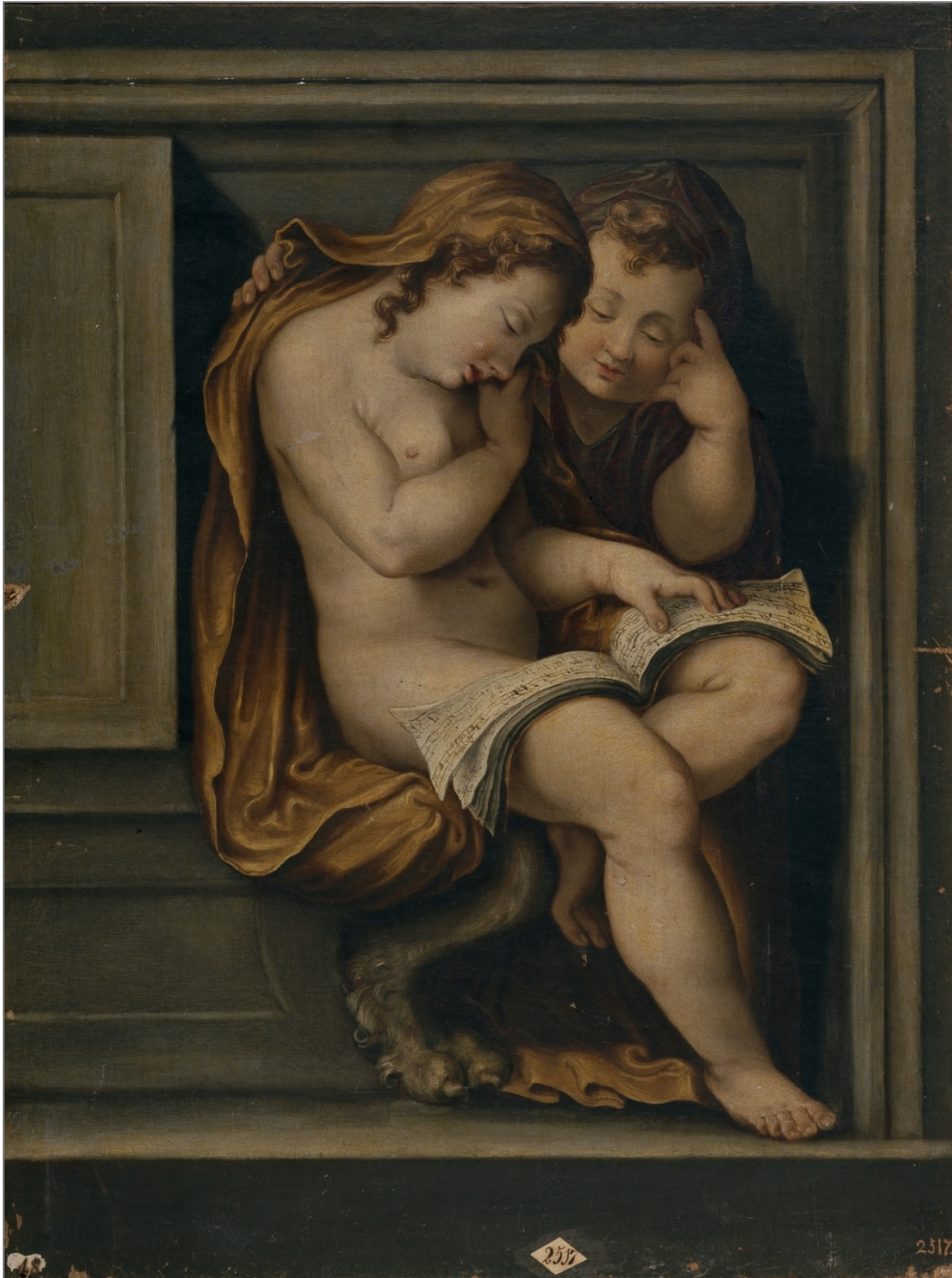
Anónimo, Dos cupidos leyendo (siglo XVI). Museo Nacional del Prado, Madrid.