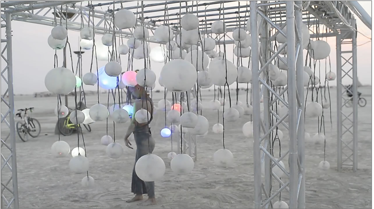
Aaron Sherwood, MICRO (2015). Instalación-performance.