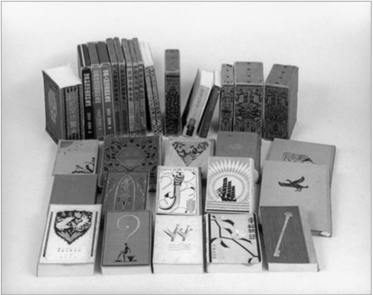
Hisui Sugiura, Book covers and other design works (32 pieces) (1920-1952). National Museum of Modern Art, Tokyo.