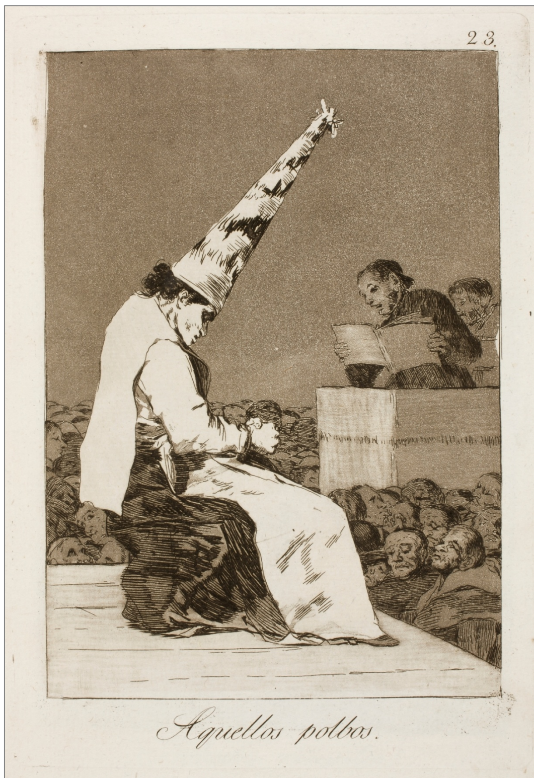
Francisco de Goya y Lucientes, Aquellos polbos (1797-1799). Museo Nacional del Prado, Madrid.