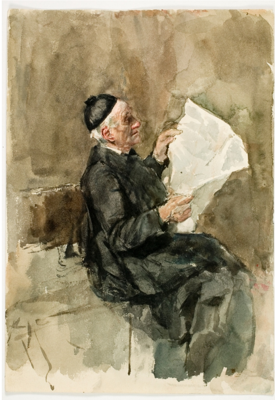
Mariano Fortuny y Marsal: Sacerdote leyendo el periódico , acuarela en papel. Museo del Prado .