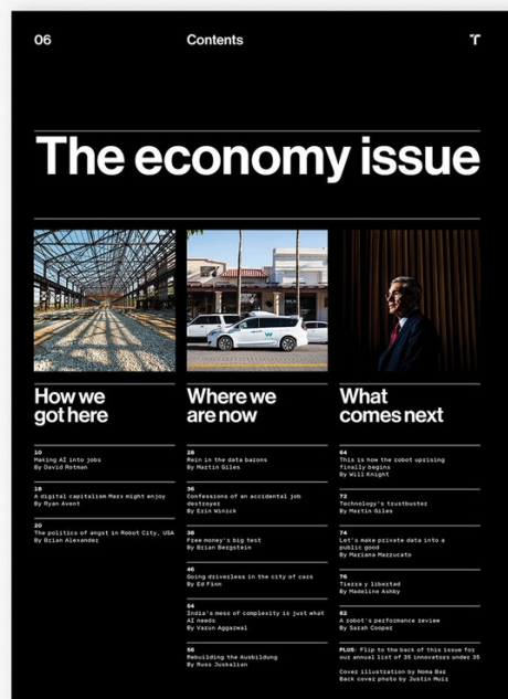
Dos imágenes del diseño editorial y de marca de Pentagram para la MIT Technology Review .