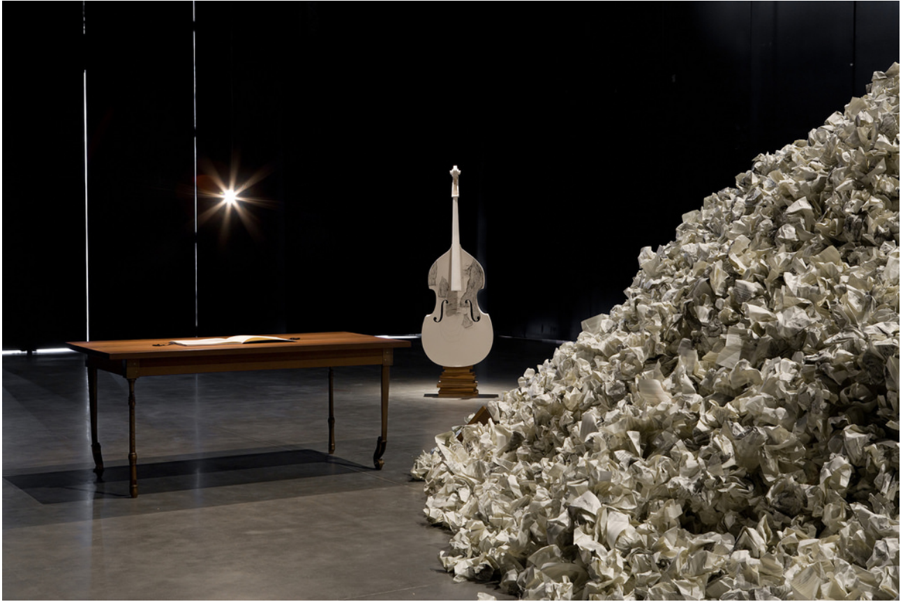
Sandra Cinto, En silencio . Instalación.